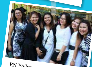
PN Philippines lors de la remise de diplômes le 28 mars