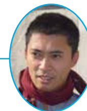
HAKARA TEA, 1 ER MANAGER DE PN CAMBODGE

OUVERTURE D'UN 3 ÈME CENTRE À DANANG, AU VIETNAM (PNV)