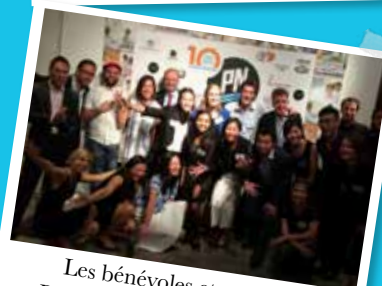
Les bénévoles et amis de PN Hong Kong lors du 10 ème anniversaire de PN le 2 novembre