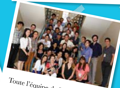
Toute l'équipe de PN Cambodge