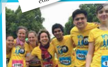
L'équipe de Passerelles numériques France soutenant PN à « La course des Héros » le 21 juin