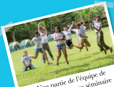
Une partie de l'équipe de PN Philippines au séminaire d'intégration en septembre