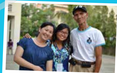
Seakliv (« vie en entreprise »), Linda (administration) et Monsieur Yum (gardien) à PN Cambodge